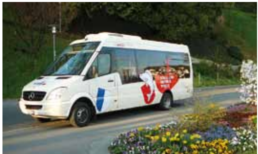
Mercedes-Benz City Sprinter 65 Einsatz auf der Weggiser Schul- und Ortsbus-Linie.