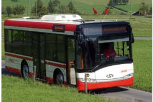
Solaris Alpino 8.6 Einsatz auf den Linien 60 und 61 (Ortsbus Schwyz)

Beide neuen Fahrzeuge verfügen über mindestens einen stufenlosen Einstieg (Niederflur), einen klimatisierten Fahrgastraum und modernste Abgas-Filtertechnologie.