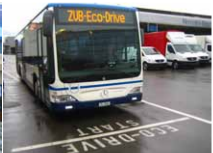
Speziell ausgerüstetes Fahrzeug mit Treibstoffverbrauchs- und Komfortmessgerät.