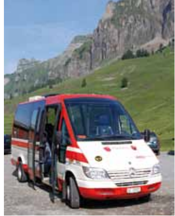
Weit über die Region bekannt: der beliebte Pragelbus.

Hoffnungsvoll gestartet, erfolgreich betrieben, hohe Akzeptanz erfahren und doch ohne Happy End.